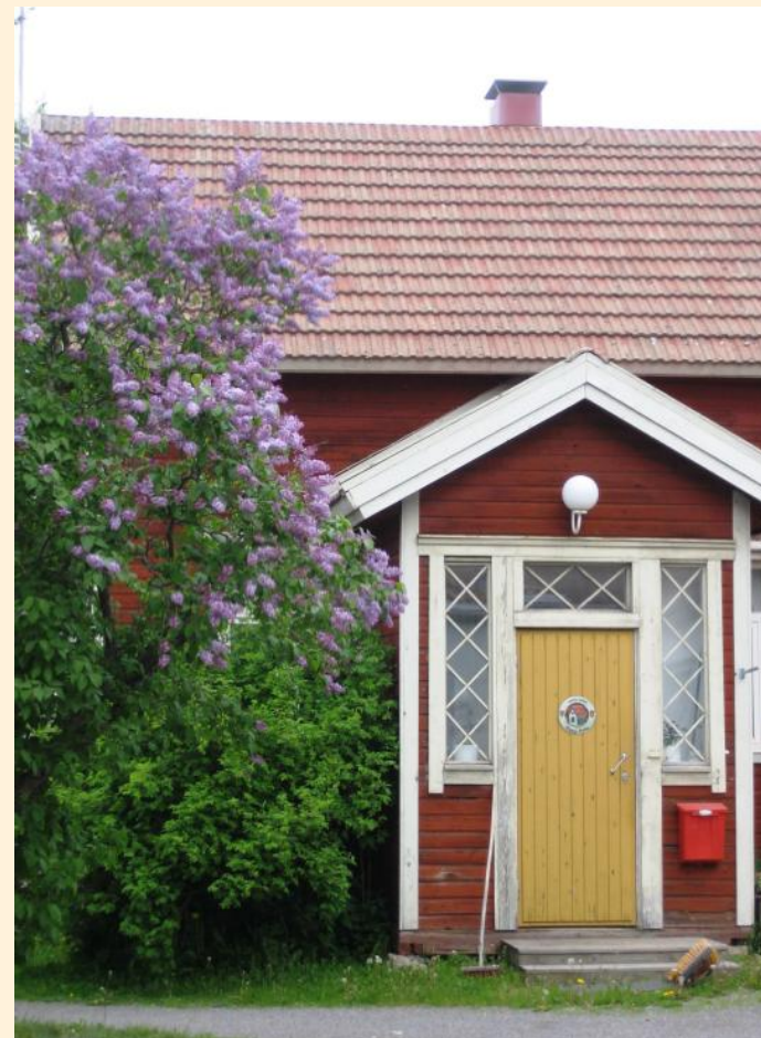
Ulkoapäin entistetyssä asunnossa on kaikki nykyajan mukavuudet.