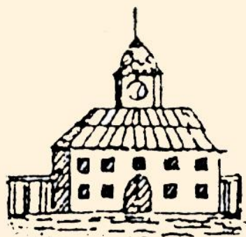
Raahen ensimmäinen ja toinen raatihuone.