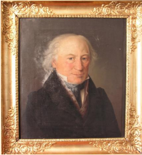
Fredrik Sovelius vanhempi