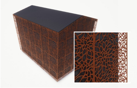
2. Esimerkki muuntamon käsittelystä: Muuntamo verhottu kuvioidulla corten-teräslevyllä.

Tielinjauksen luonne tulee huomioida myös alueelle sijoittuvan puistomuuntamon toteutuksen laatutasossa. Vaatimaton peltiverhottu muuntamo ei ole sellaisenaan sallittu toteutustapa, vaan muuntamo tulee verhota alueen kulttuuriympäristöä kunnioittavalla tavalla.