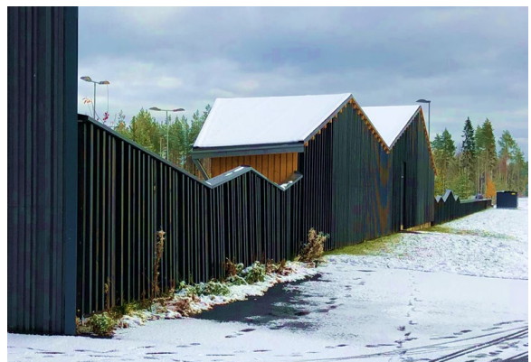
3. Oulun Hiukkavaaran monitoimitalon pihaidan yksityiskohta.

kohta, jonka toteutukseen tulee kiinnittää erityistä huomiota. Tontin kulmaukseen tulee sijoittaa maisemallinen kiintopiste, joka voi olla esimerkiksi valaistu maisemapuu, lipputanko tai jokin muu mastoaihe. Kiintopiste voi olla myös korttelia rajaavaan aitaan liittyvä elementti, kuten valaistu muotoaihe aidan kulmauksessa tai alueen aiempaan käyttöön (Palon kansakoulu) liittyvä maalaus. Sivulla 9. olevan havainnekuvan etualalla on esitetty esimerkki mahdollisesta valaistusta muotoaiheesta.