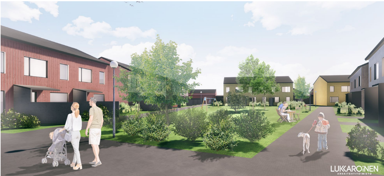
1. Näkymä sisäpihalle.