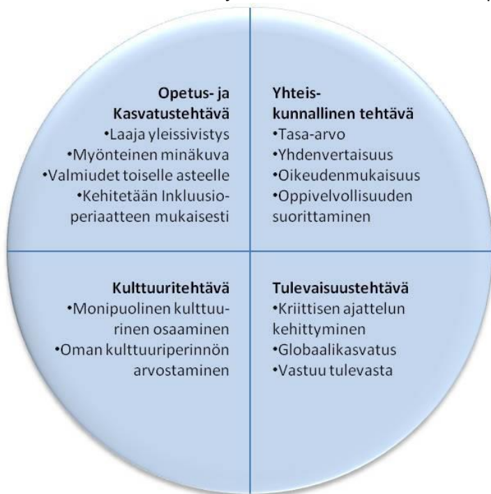
Kuva 2. Perusopetuksen tehtävä

Perusopetus on koulutusjärjestelmän kivijalka ja samalla osa esiopetuksesta alkavaa koulutusjatkumoa. Perusopetus tarjoaa oppilaille mahdollisuuden laajan yleissivistyksen perustan muodostamiseen ja oppivelvollisuuden suorittamiseen. Se antaa valmiudet ja kelpoisuuden toisen asteen opintoihin. Se ohjaa oppilaita löytämään omat vahvuutensa ja rakentamaan tulevaisuutta oppimisen keinoin.