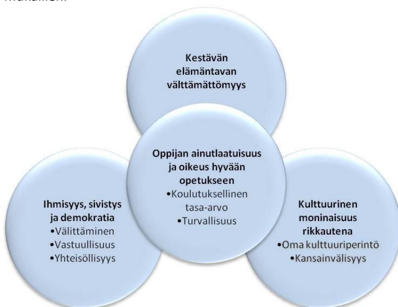
Kuva 1. Raahen perusopetuksen arvo perusta

Raahen perusopetuksen arvo perusta on laadittu Perusopetuksen opetussuunnitelman arvo perustaa mukailleen.