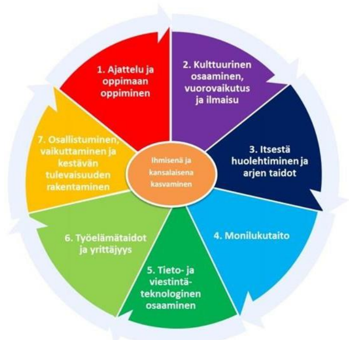
Kuva 3. Laaja-alainen osaaminen (Opetushallitus)

Laaja-alaisen osaamisen tavoitteet täsmennetään luvuissa 13, 14 ja 15 vuosiluokkakokonaisuuksittain. Tavoitteet on otettu huomioon oppiaineiden tavoitteiden ja keskeisten sisältöalueiden määrittelyssä. Oppiaineku-vauksissa osoitetaan oppiaineiden tavoitteiden yhteys laaja-alaiseen osaamiseen.