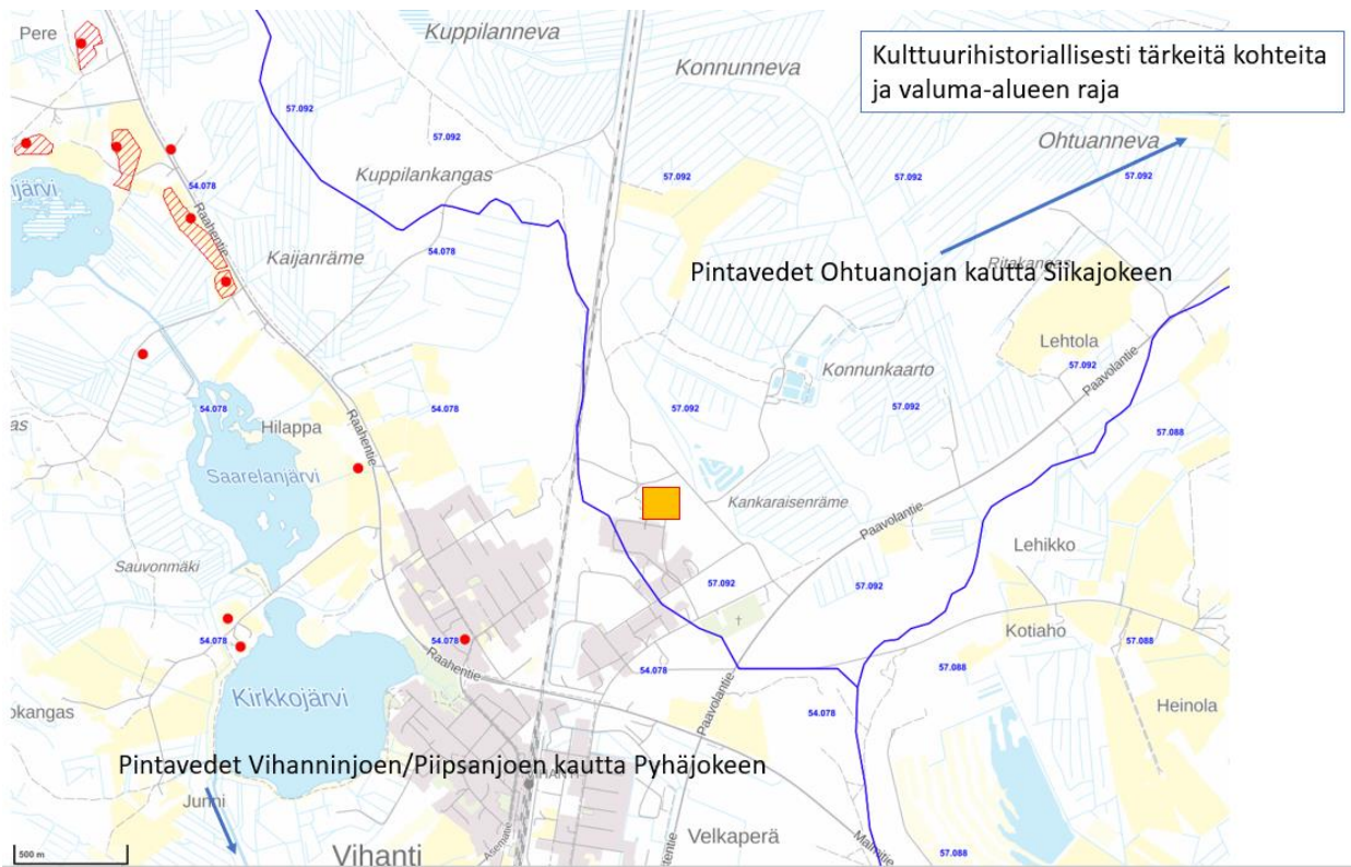
Kuva 1. Kulttuurihistoriallisesti tärkeitä kohteet (merkitty punaisilla pisteillä) ja valuma-alueiden rajat (merkitty sinisellä).