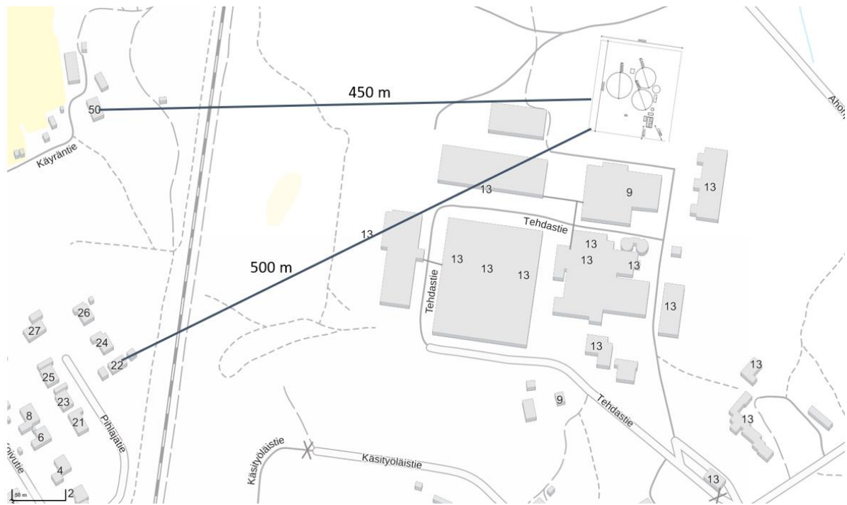
Kuva 3. Etäisyys lähimpiin asuttuihin naapureihin.